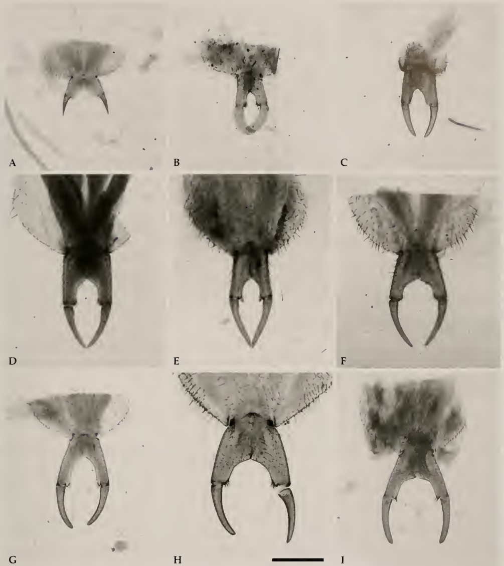
Abb. 2A-I. Originalpräparate aus der Verhoeff-Sammlung. Gonopoden der Weibchen. A. Micropriona attensis , nomen nudum. B. Eremopoda pachypus , nomen nudum für Pesvarus pachypus Würmli, 1974. C. Thereuopodina adjutrix , nomen nudum. D. Scutigera coleoptrata (Linné, 1758). E. Scutigera asiaeminoris Verhoeff, 1905. F. Scutigera mohamedanica Verhoeff, 1936. G. Thereuopoda haasei Verhoeff, 1937 [gültiger Name: Thereuopoda longicornis (Fabricius, 1793)]. H. Thereuopoda flagellifera meggittii Verhoeff, 1937 [gültiger Name: Thereuopoda longicornis (Fabricius, 1793)]. I. Thereuopoda singaporiensis Verhoeff, 1937 [gültiger Name: Thereuopoda longicornis (Fabricius, 1793)]. Balken: 500 µm.

Herkunft: Locus typicus: "See Genezareth" (Palästina)